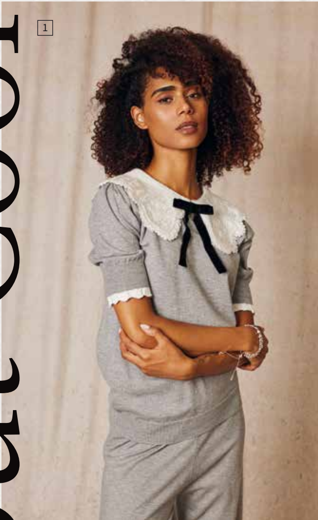
Cool und stilvoll sind die New Basics im Herbst 2024.