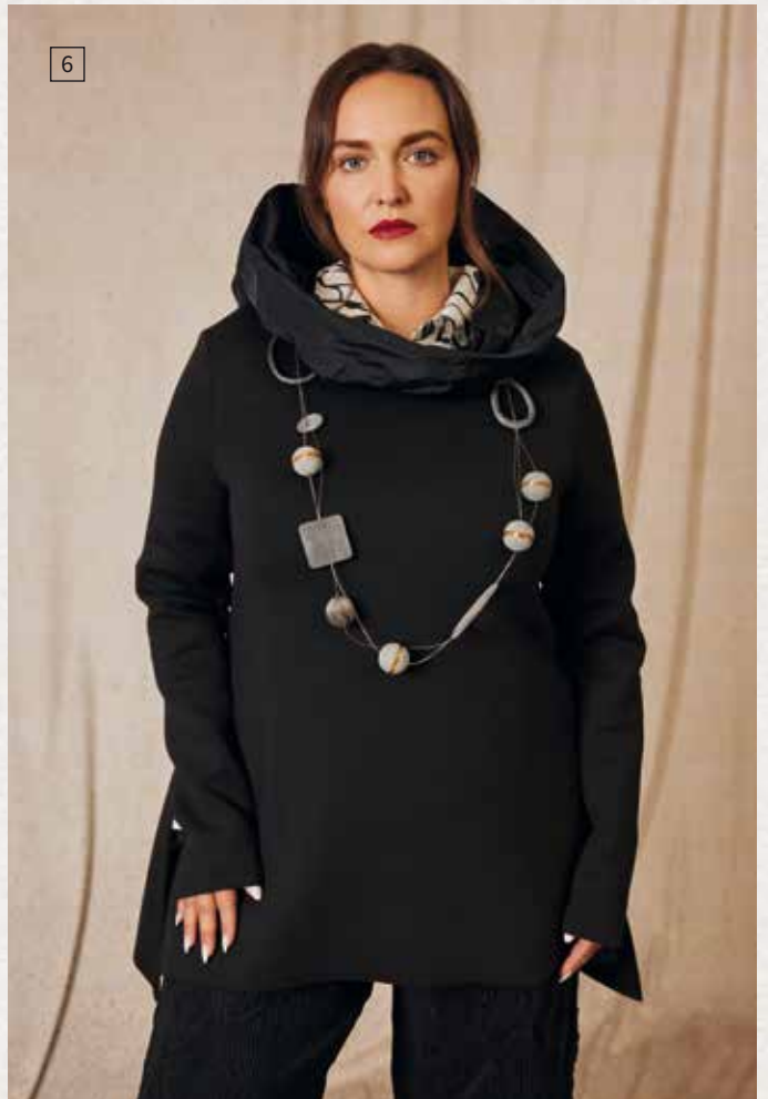
4 MAY GEM GmbH EG, R. 016-018